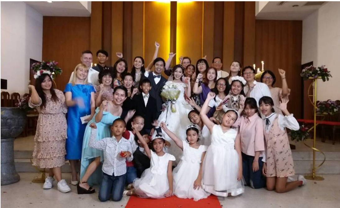
Rakasta rupusakkia. Kuva nuorenparin häistä seurakunnassamme.

Buddhalainen munkki on kuulemma sanonut, ettei ole ollenkaan huolestunut siitä, että ihmisiä kääntyy kristinuskoon. Hänen mukaansa kristityksi kääntyvät ovat yleensä rupusakkia, jolla ei ole mitään mahdollisuuksia edetä korkealle tasolle hengellisessä ajattelussaan. Miten osuva määritelmä meistä! Joskus ulkopuoliset vaan näkevät asiat selkeästi ja osaavat tehdä osuvan analyysin. Juuri sitähan me olemme: itsessämme täysin toivotonta rupusakkia, joka ei omin voimin pääse yhtään mihinkään. Rupusakkia, joka elää armosta. Ja kun itessään täysin toivoton rupusakki löytää armon, tapahtuu jotain yllättävää: rupusakki saa bonuksena uuden identiteetin kuninkaan poikina ja tyttärinä.