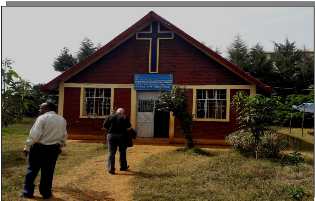
Kuvassa yksi Jimman kolmesta Mekane Yesus kirkosta