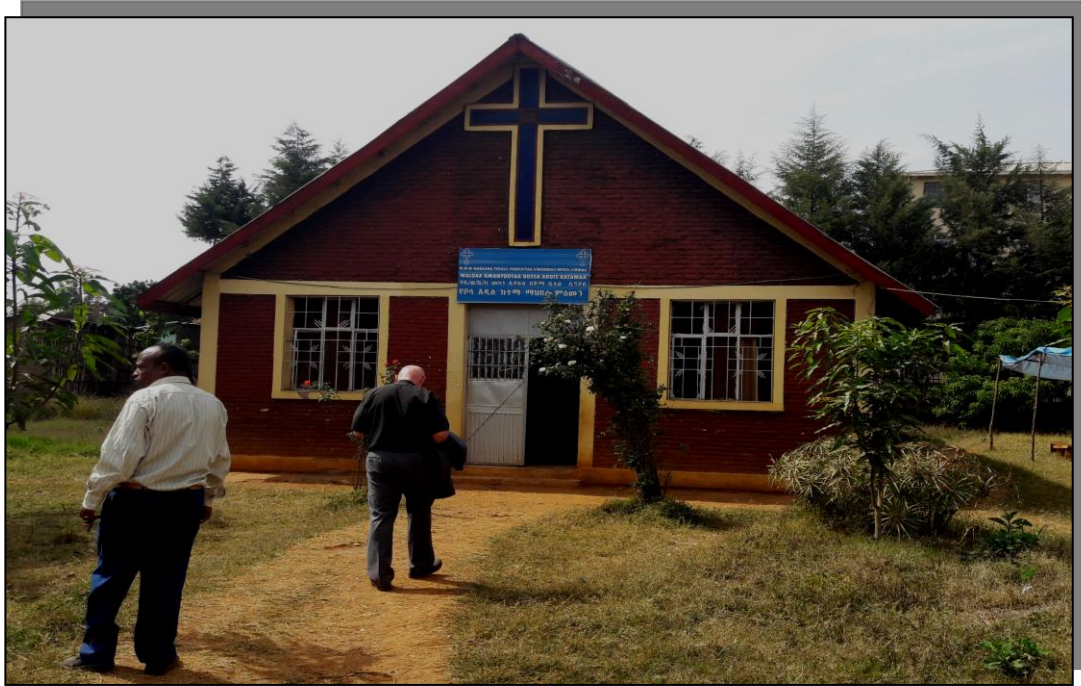
Kuvassa yksi Jimman kolmesta Mekane Yesus kirkosta